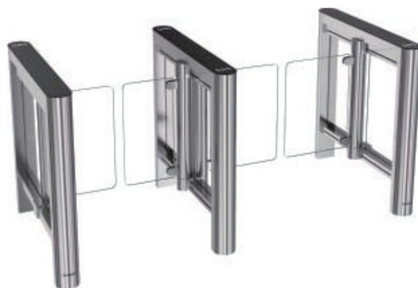
EasyGate SG 1000 (runda hörn)