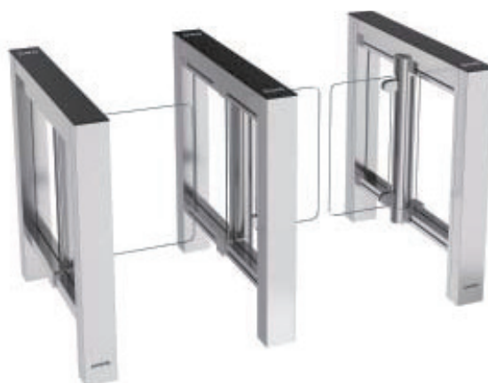
EasyGate SR 1000 (rektangulära hörn)