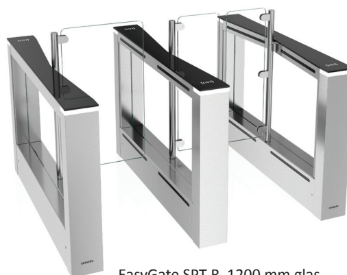
EasyGate SPT-R 1200 mm glas