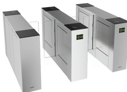
EasyGate LH 940