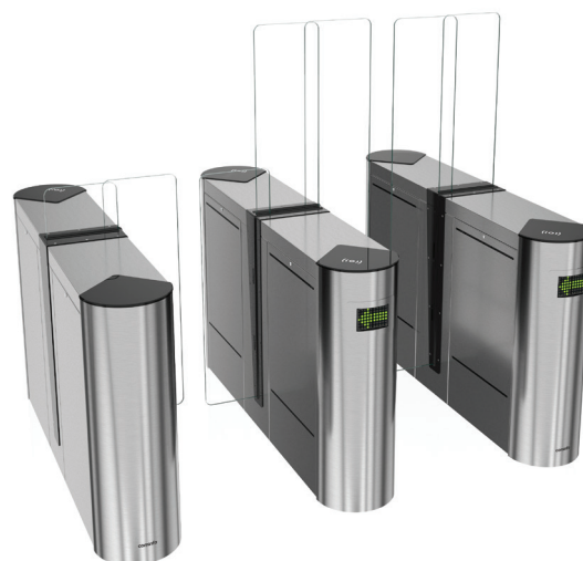
EasyGate LX 1200 / 1800