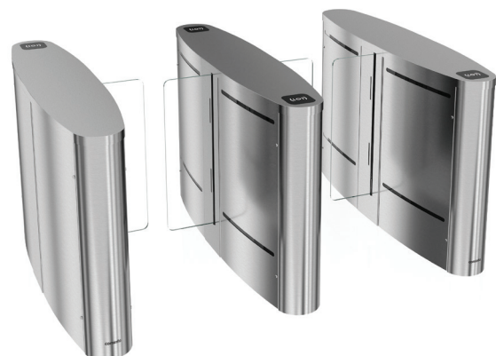
EasyGate LG 940