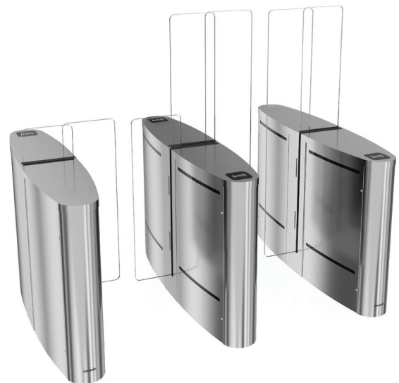
EasyGate LG 1200 / 1800